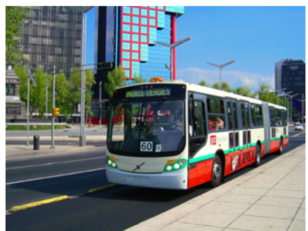
Autobús perteneciente a la Ruta A