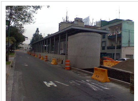
Avance de obra de la estación Parque Lira de la Ruta B (Septiembre de 2008)|250px