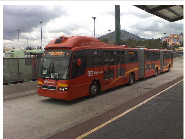
Volvo 7300 BRT biarticulado.